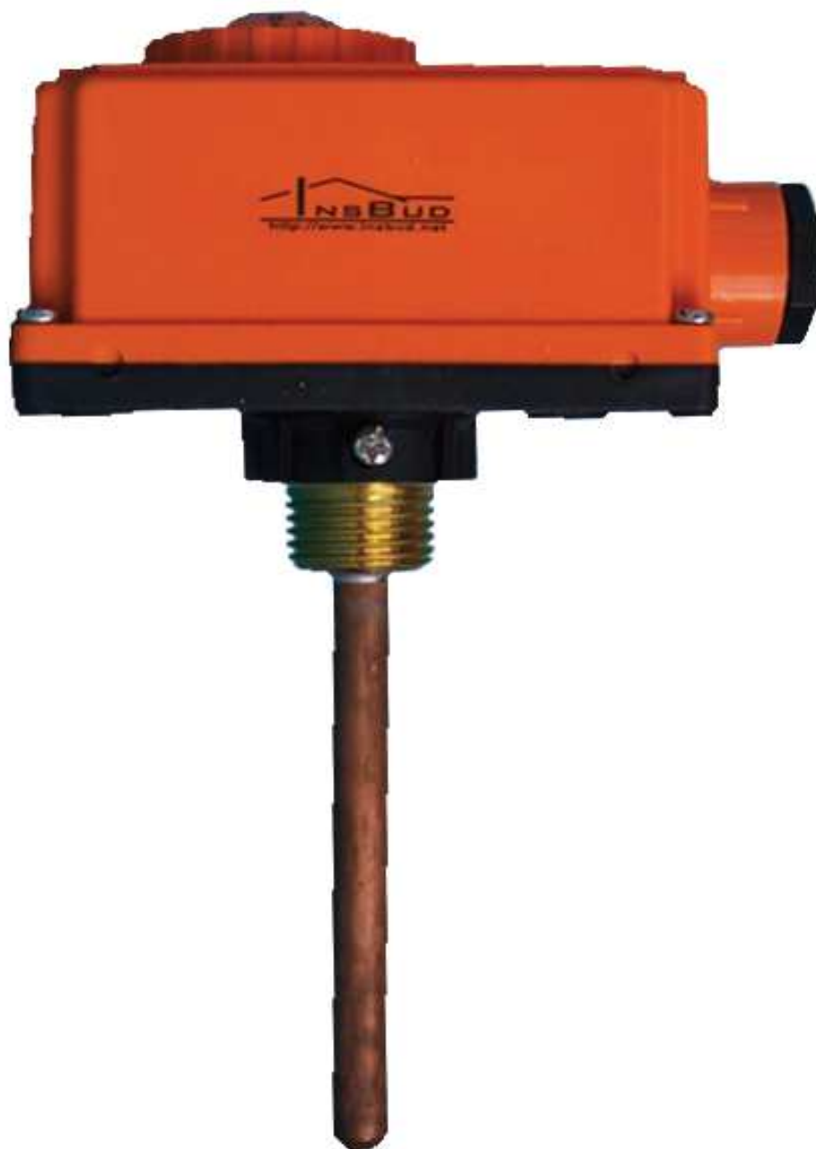
Termostat zanurzeniowy IB – Therm 02