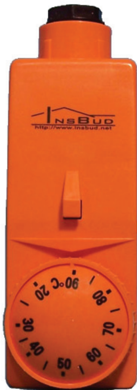
Накладной термостат IB – Therm 01